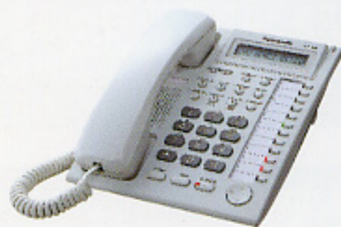
KX-T7730* 顯示型、免持聽筒對講話機