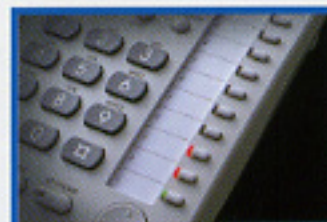
▲可程式鍵具有雙色燈