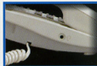
▲外接頭戴式耳機插孔