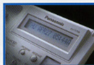
▲16字元大型液晶顯示